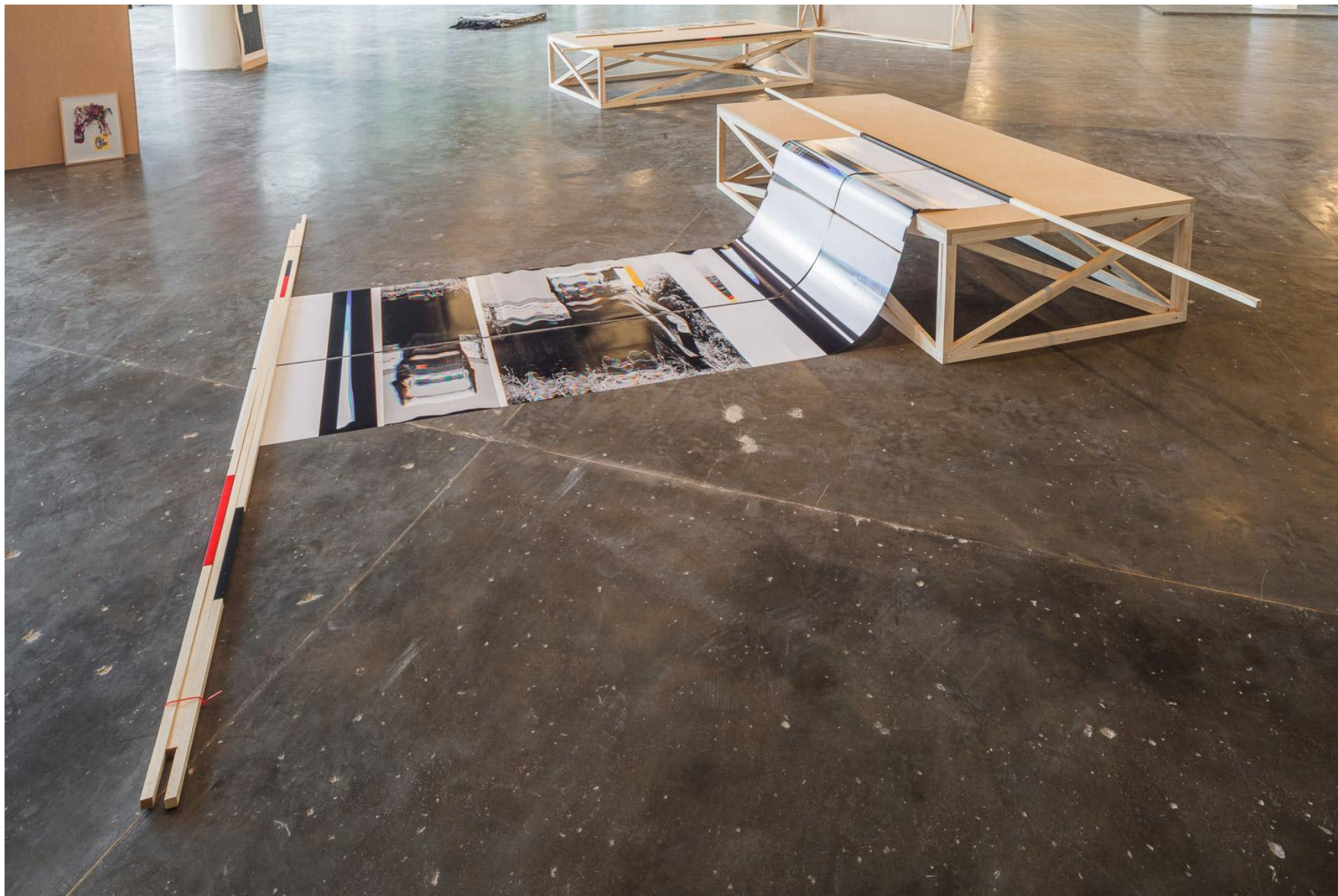
Seb Patane, Other Libertines , 2016, Installation view, SP-ARTE São Paulo, Open Plan Section