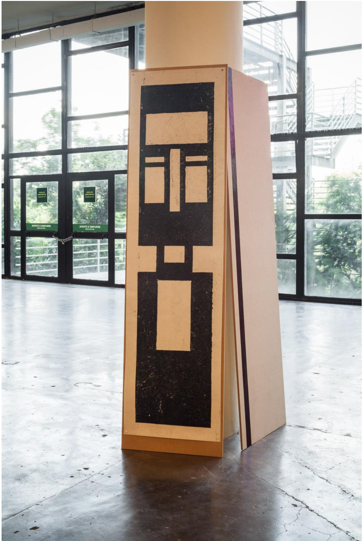
Seb Patane, Other Libertines , 2016, Installation view, SP-ARTE São Paulo, Open Plan Section