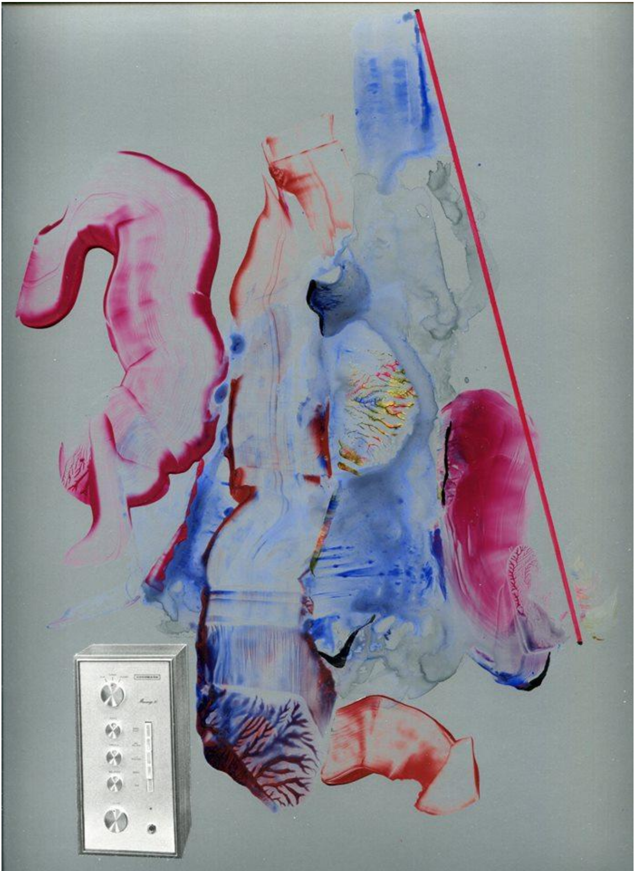
Seb Patane, Twin Axiette , 2016, acrylic, ballpoint pen, ink, enamel and collage on colour card, cm.42 x 30 (detail)