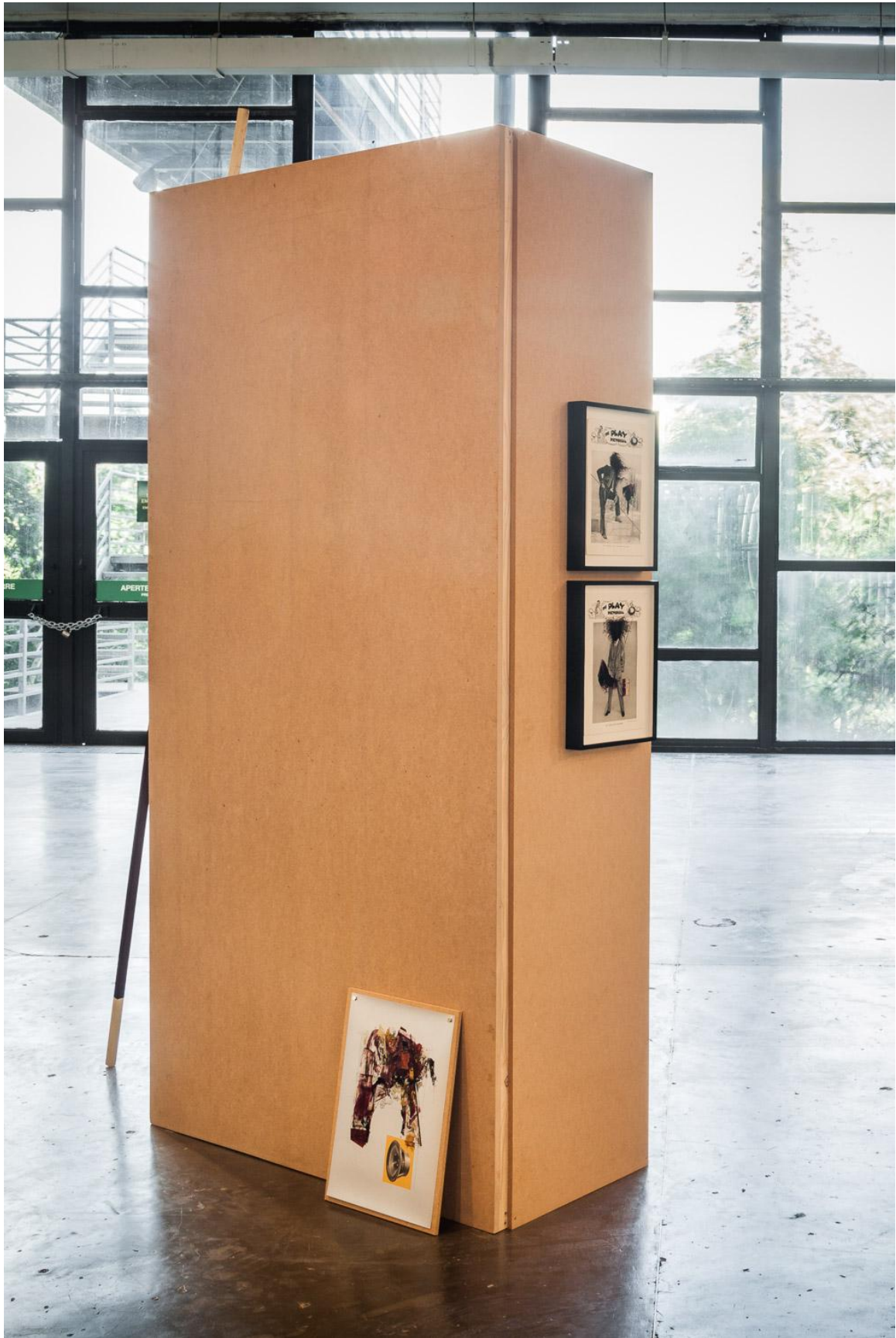
Seb Patane, Other Libertines , 2016, Installation view, SP-ARTE São Paulo, Open Plan Section