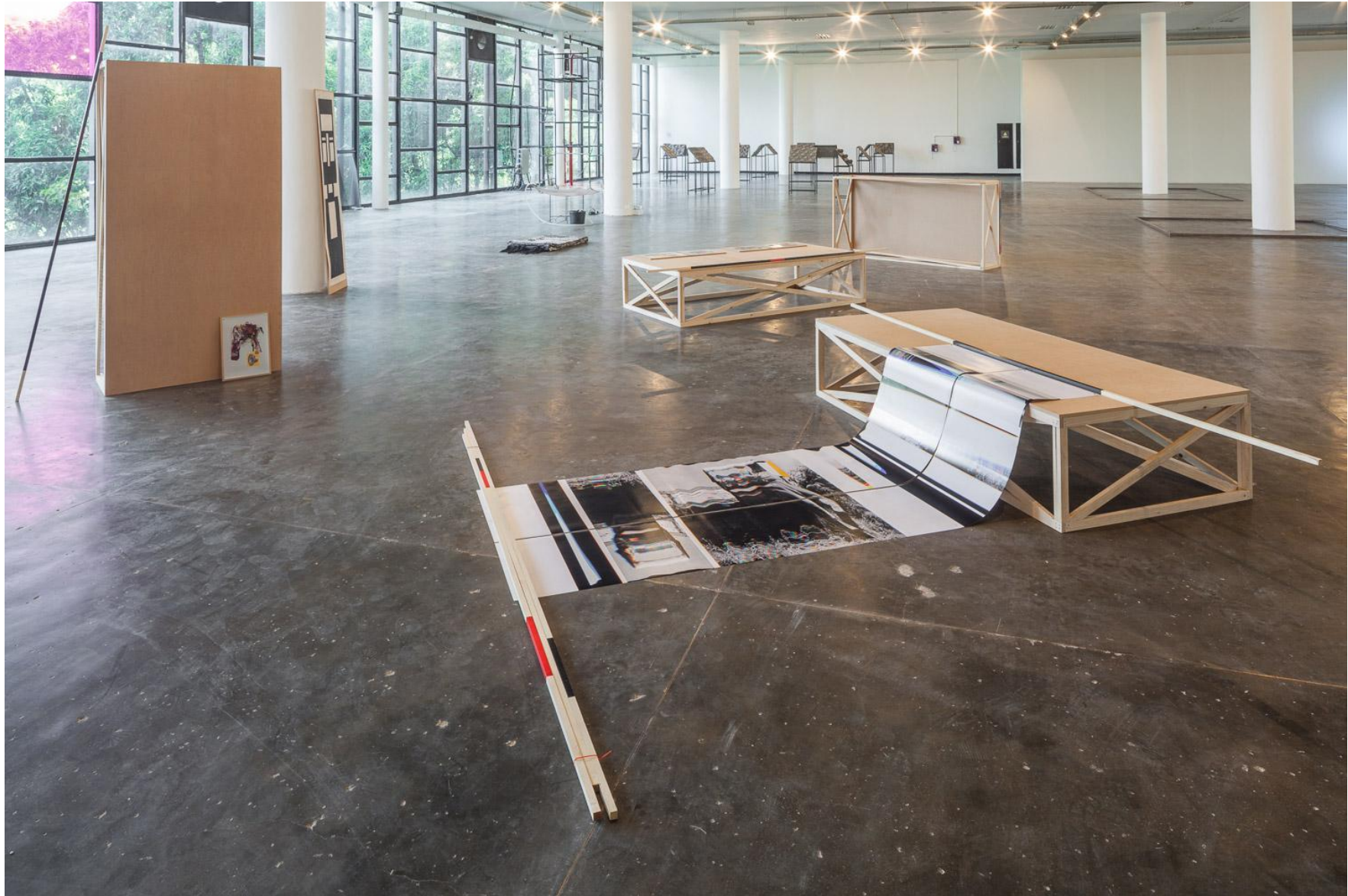
Seb Patane, Other Libertines , 2016, Installation view, SP-ARTE São Paulo, Open Plan Section