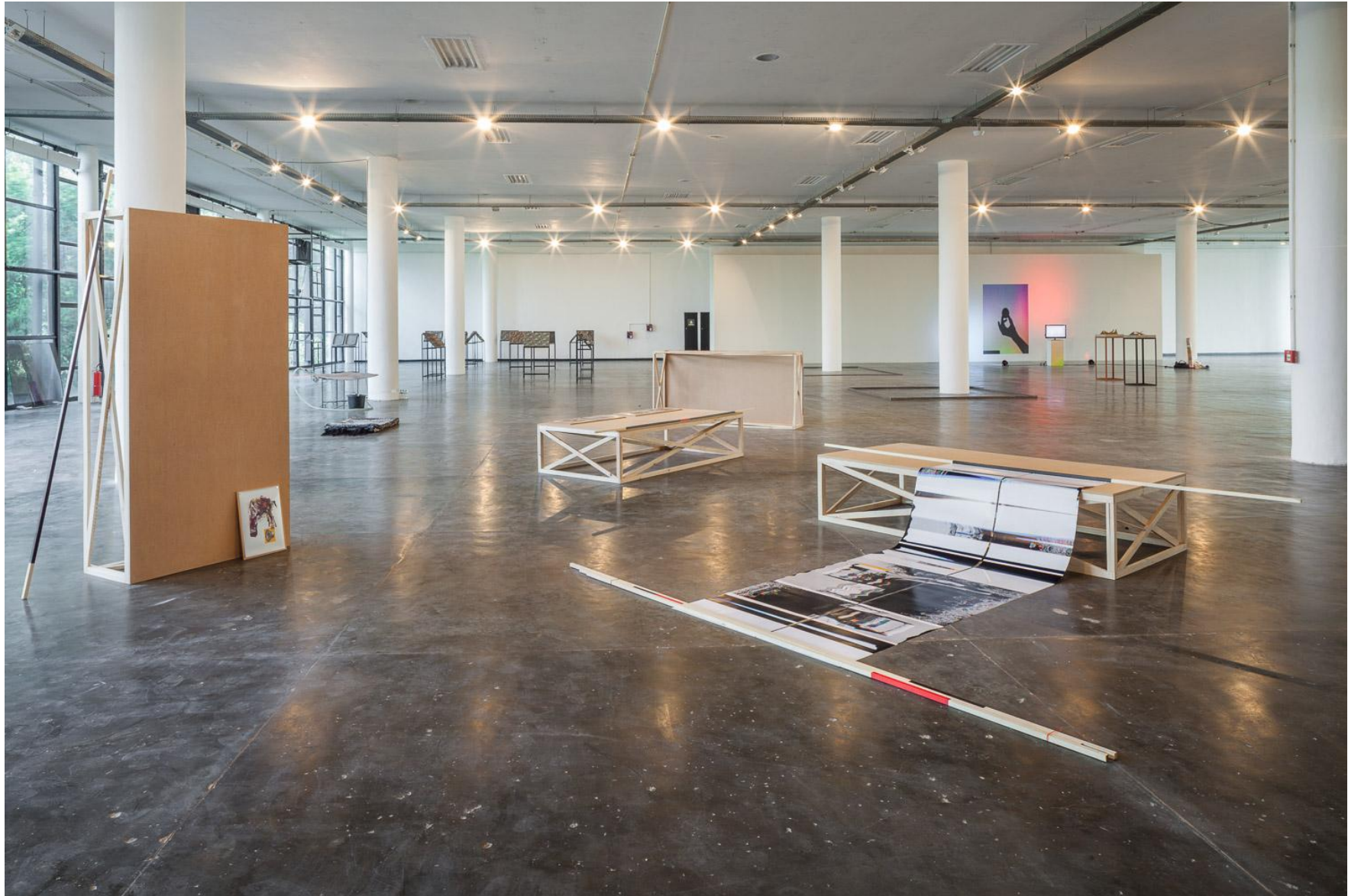
Seb Patane, Other Libertines , 2016, Installation view, SP-ARTE São Paulo, Open Plan Section