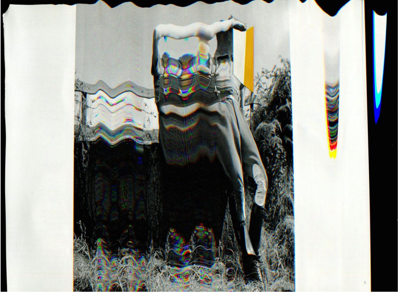
Seb Patane, Other Libertines , 2016, digital scan from printed paper/collage, work in progress