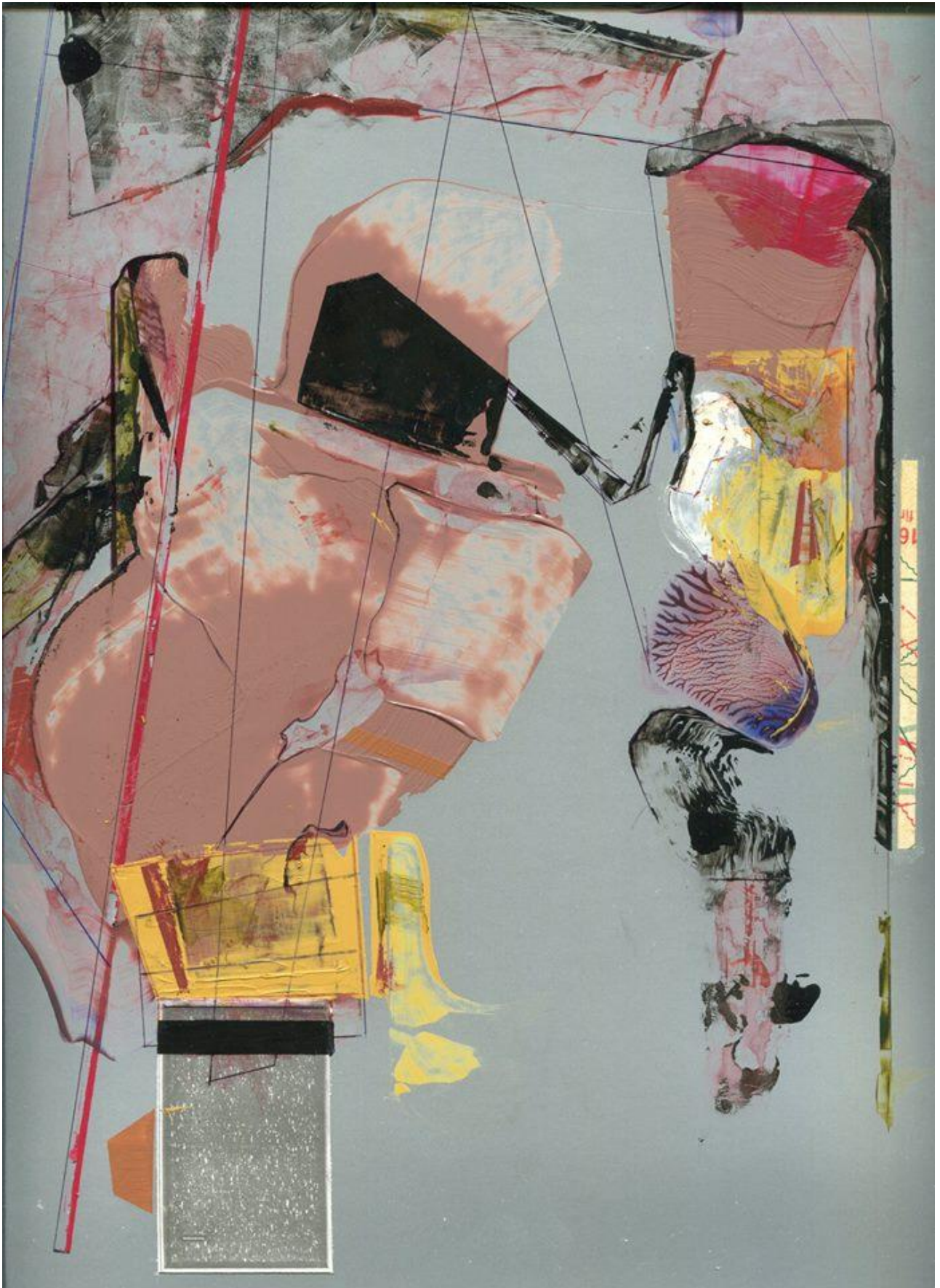
Seb Patane, Audiom 81 , 2016, acrylic, ballpoint pen, ink, enamel and collage on colour card, cm. 42 x 30 (detail)