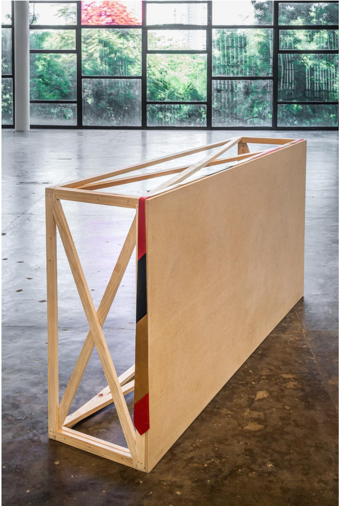
Seb Patane, Other Libertines , 2016, Installation view, SP-ARTE São Paulo, Open Plan Section