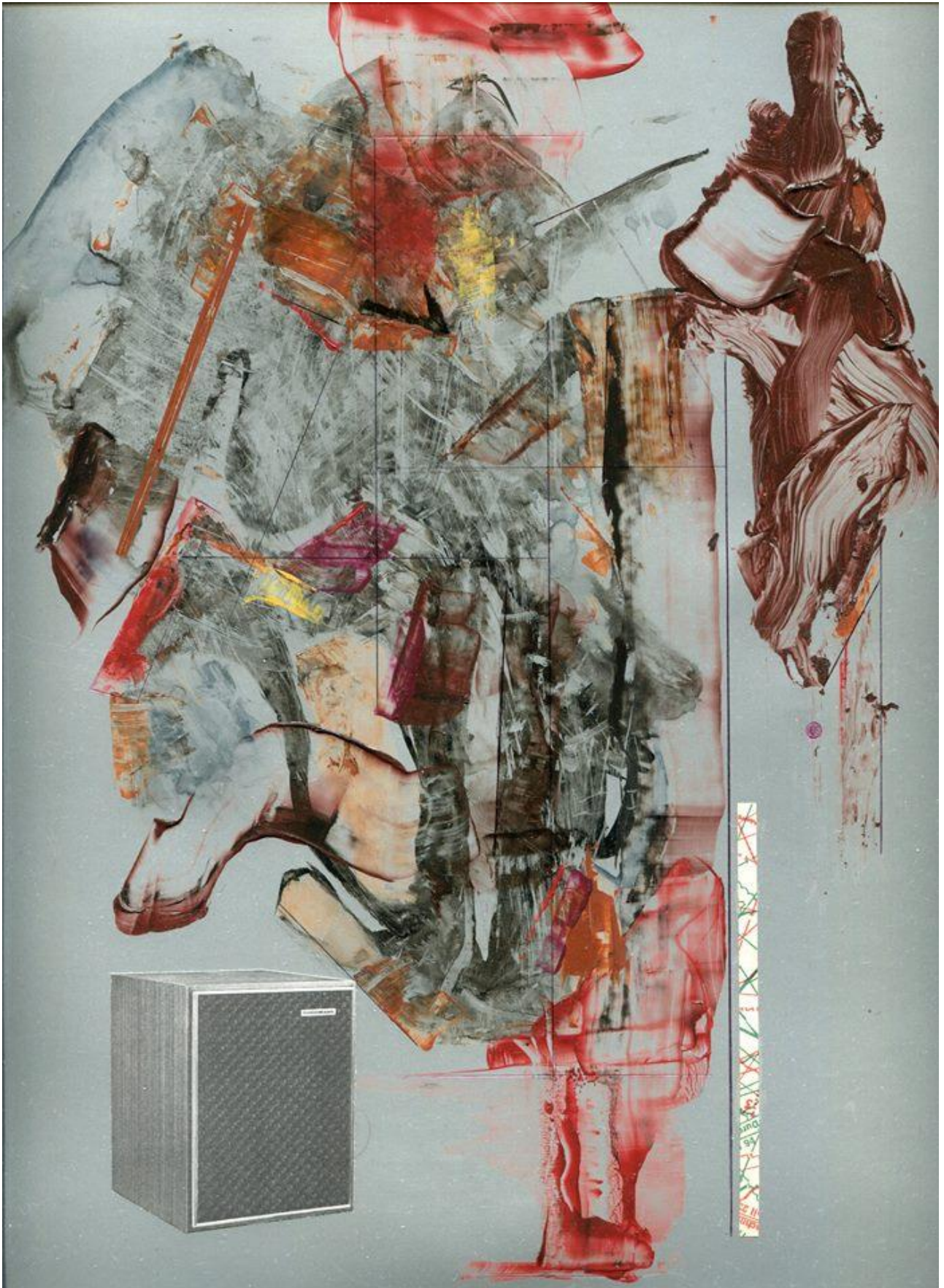
Seb Patane, Axiom 80 , 2016, acrylic, ballpoint pen, ink, enamel and collage on colour card, cm. 42 x 30 (detail)