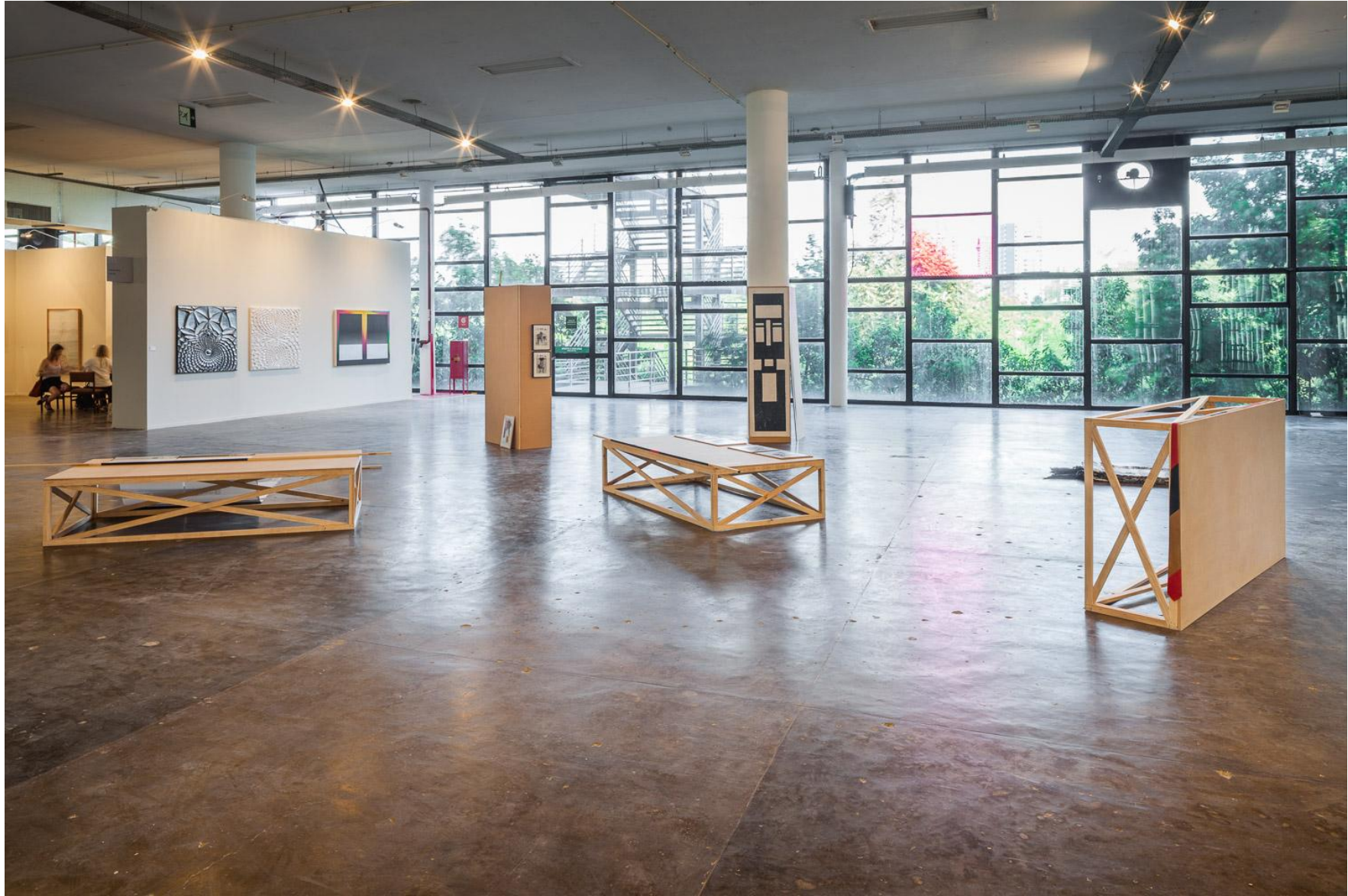
Seb Patane, Other Libertines , 2016, Installation view, SP-ARTE São Paulo, Open Plan Section